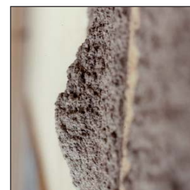
Possibilité de charger jusqu'à 100 mm Possibility to load up to 100 mm