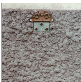
Plaque 3 trous \varnothing 20 Buse longue \varnothing 4 Plate 3 holes \varnothing 20 Long nozzle \varnothing 4