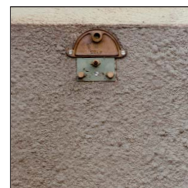
Plaque 1 trou \varnothing 14 Buse courte \varnothing 4 Plate 1 hole \varnothing 14 Short nozzle \varnothing 4