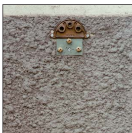
Plaque 3 trous \varnothing 14 Buse \varnothing 2,7 Plate 3 holes \varnothing 14 Nozzle \varnothing 2,7