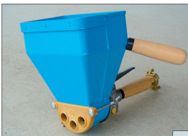
◀ ENDUIVIT 3 Mural / Wall

POUR LA PROJECTION DES ENDUITS DE FAÇADES FOR SPRAYING FACADE COATINGS