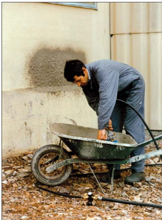
Chargement du bac Filling up