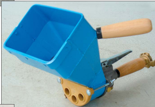
▲ ENDUIVIT 3 Plafonnier / Ceiling