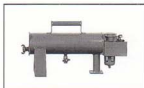
2 500 l/mn