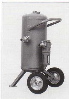
12 000 l/mn