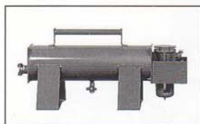
6 000 l/mn